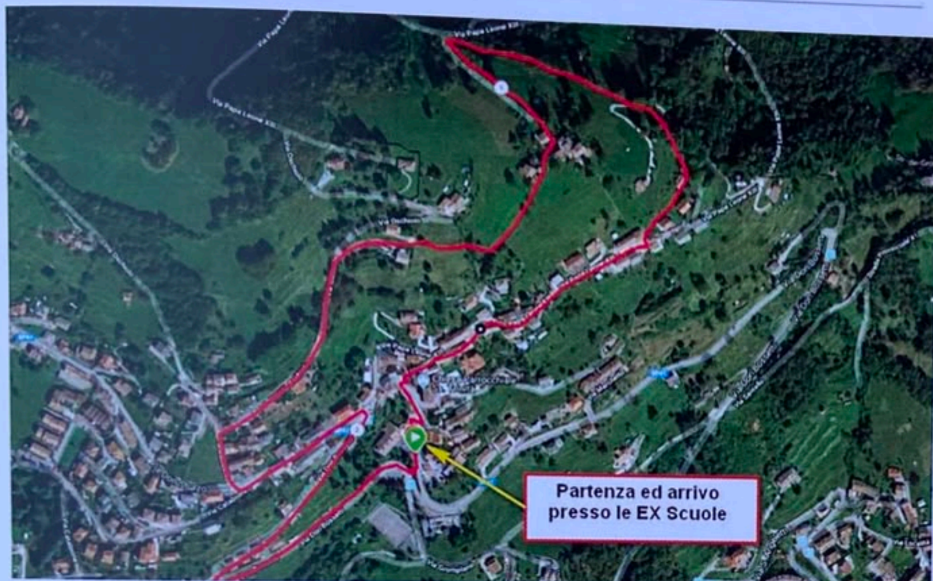
FRAZIONE PODISTICA M. 2650